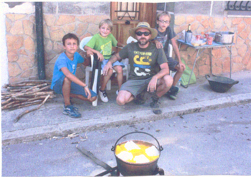
Haciendo gachas con mi padre y mis hermanos

Una comida hecha con agua, harina, colorante, mucha paciencia y un frito de tocino y sardinas. Se hace en un caldero (Mira la foto) y al fuego de leña. Luego todo el pueblo las comparte con la famosa frase "cuchará y patrás".