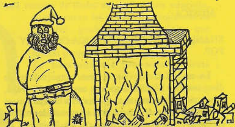
Mª Angeles Serrano Mendizábal - 1er. E.S.O.